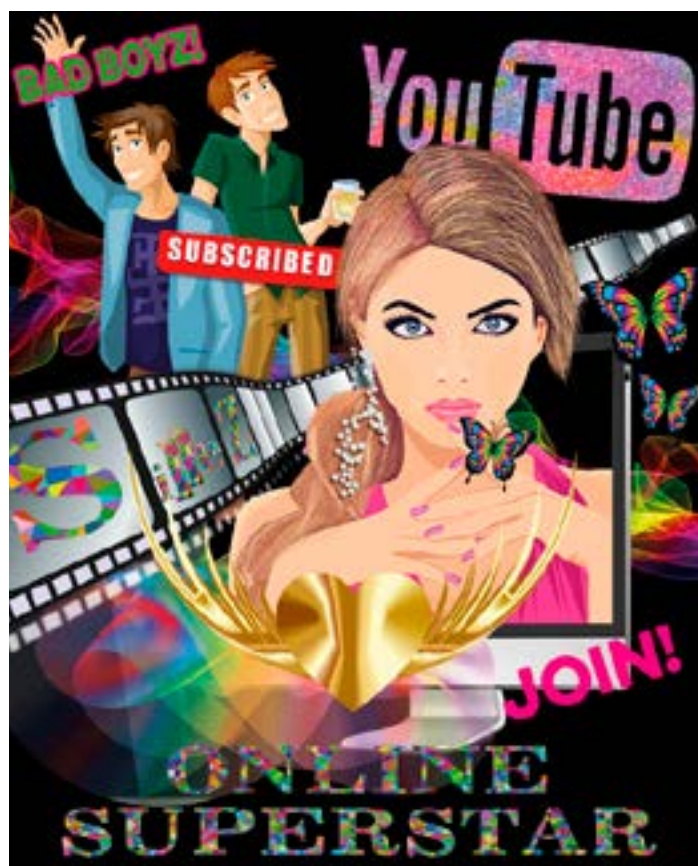
Plakaten for Online Superstar er et forsøg på at skabe det univers, forestillingen foregår i, på et enkelt billede.

Vi håber, at mange vil nyde Online Superstar!