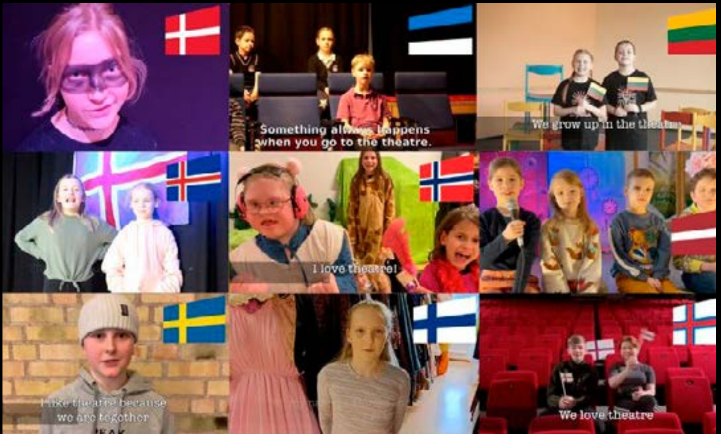
Anbefaling: Se den søde videohilsen, hvor børn fra alle NEATA-lande fortæller, hvorfor de elsker at spille teater.