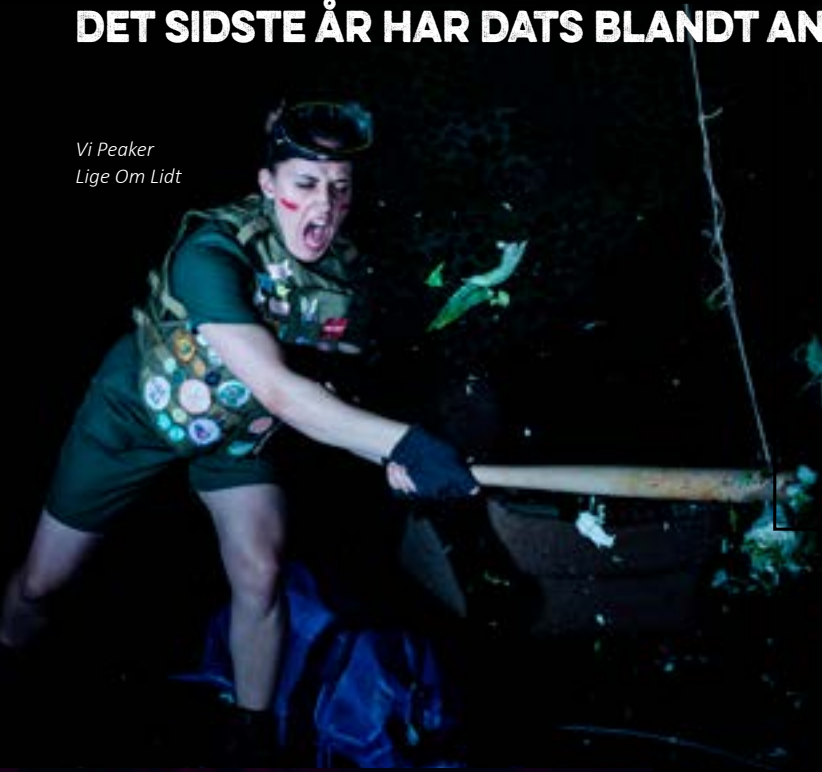
Vi Peaker Lige Om Lidt