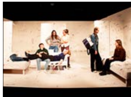
Hvis en karakter gjorde noget usympatisk, skulle de sørge for, at hun eller han også gjorde noget sympatisk.

Det har været med til at skabe en autenticitet, som i den grad lyste igennem i Menneskeoffer . Det var tydeligt, at spillerne stod på mål for de karakterer, de spillede. Med til det hører måske