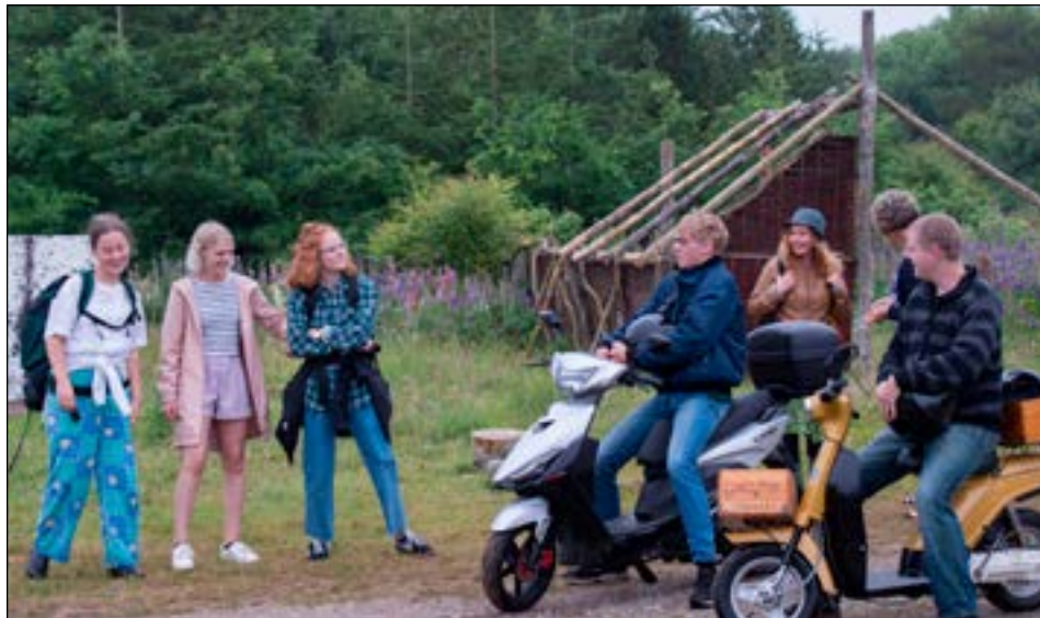
Når piger stiller krav bliver selv seje fyre miljøbevidste.

Så – det er ikke sidste gang, jeg skal til Fyrspillet og opleve deres sommerforestilling.