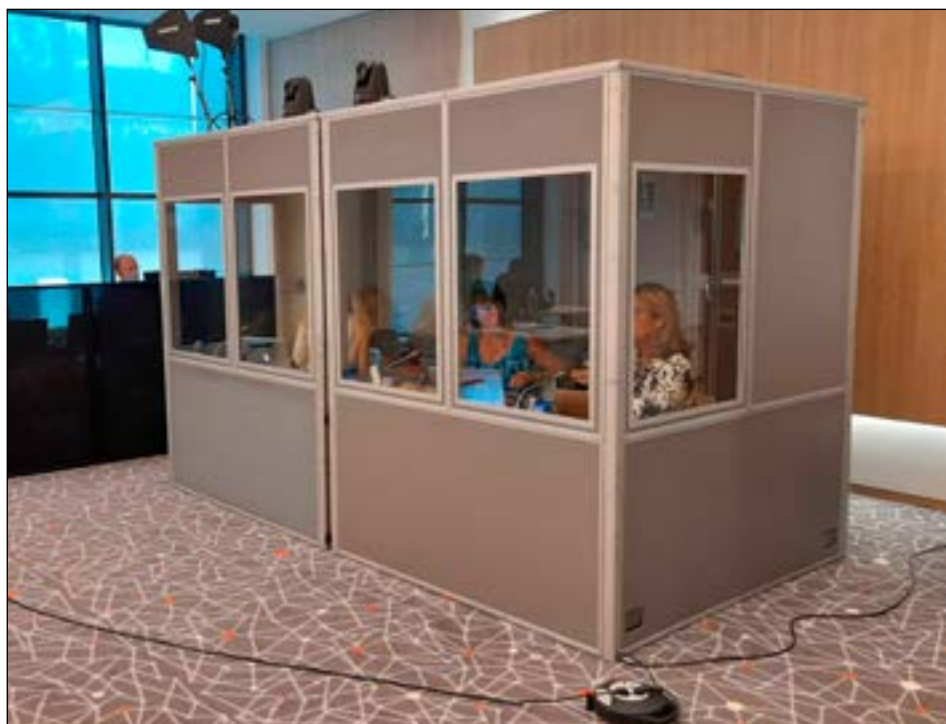
Der skal en del tolke til, når teaterfolk fra hele verden mødes.

DATS vil også gerne benytte denne anledning til at takke Villy for hans store arbejde og dedikation til det internationale samarbejde samt Danmarks involvering i AITA/IATA.