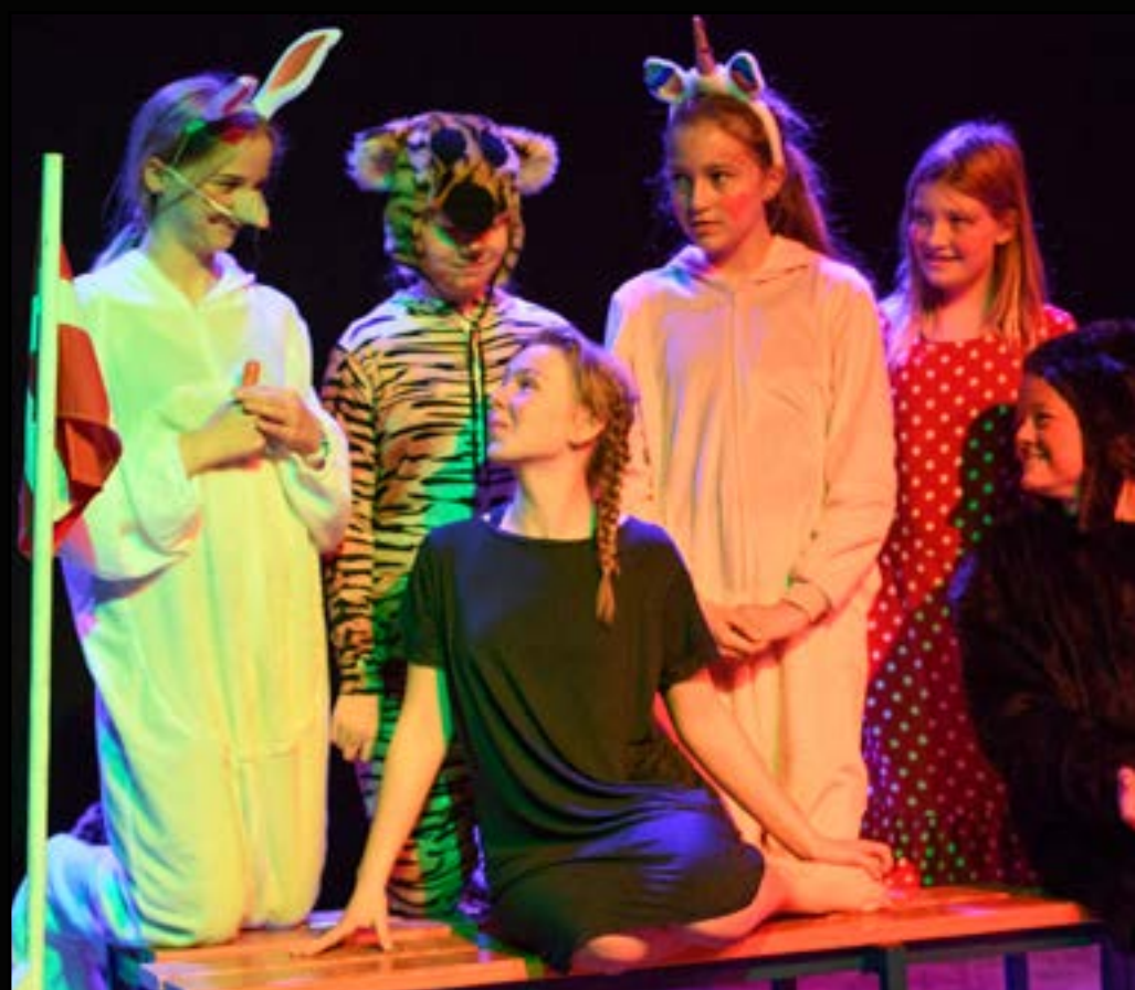
Børneteater er utroligt mangfoldigt og forskelligt. Her er det en dygtig flok fra Odense Dramaskole som opfører Minestrones Drøm ved DATS' teaterfestival 2021.

jeres tilgang, udfordringer og tanker med mig. Så send mig en mail på signe@dats.dk – så kan vi enten aftale, at jeg kommer forbi til en snak, eller at vi tager den telefonisk. Jeg ser frem til at høre fra jer.