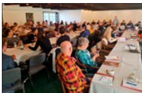
Der var flot tilslutning til DATS' generalforsamling 2021