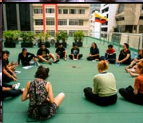
Fem unge danskere deltager i det spændende projekt.