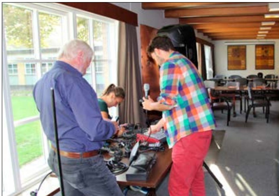
Spændende teatertechnik tiltrækker sig altid opmærksomhed

konstruktive idéer til programmet. Det var også en kærkommen mulighed for sekretariatet at kunne tale med medlemmerne og høre mere om hverdagen ude hos teatergrupperne.