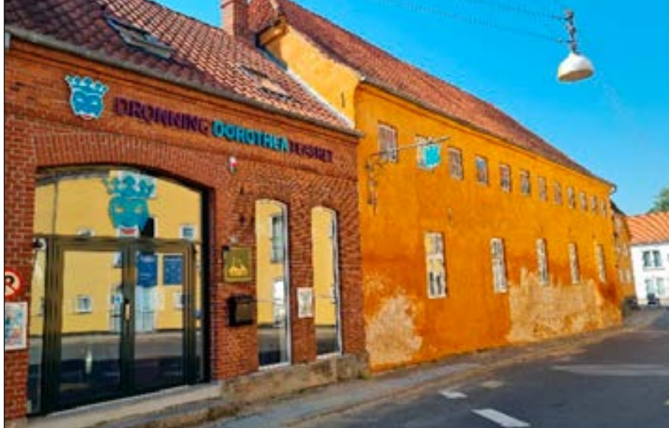
Kolding har en stærk og velfunderet amatørscene i Dronning Dorothea Teatret.

Forestillingen kredser om kærligheden, mellem mand og kone, far og datter, som nyforlelskede eller som søgende efter den eneste ene. Den går seriøst til sit tema, men giver god plads til både humor og rokkende fødder, når det vespillende orkester skruer op for perlerækken af kendte danske numre. Dorothea har samlet et rigtig dygtigt hold på scenen,