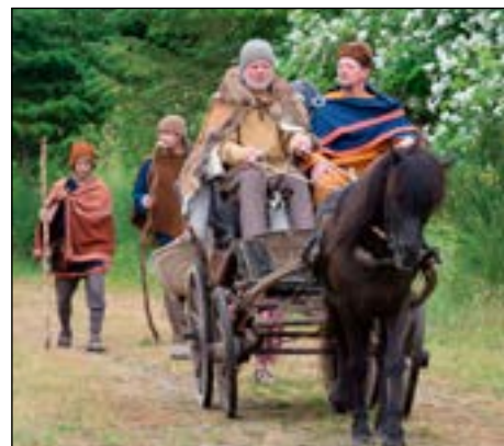
Skiftende mellem fortid og nutid oplevedes ikke som tomgang, fordi kulisserne var de samme: Naturen.

I nutiden møder vi også, om ikke en dum skid, så en selvopblæst nar, der har kastet sig over naturen, og bruger den for at promovere sig i sine tv-programmer og i sine selvhjælpsbøger. Vores selvhjælpsguru dør ikke, men oplever en deroute af de helt store, da det viser sig, at han har bygget hele sin karriere op på en rapport, der ikke er sand.