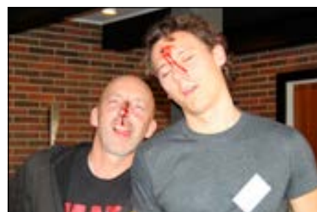
De kunstige teatersår blev virkelig realistiske

En lidt anderledes dag i DATS' regi, der blev mødt med mange positive tilbagemeldinger og